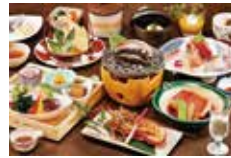
三大味覚のご夕食一例(イメージ)

紺碧の海と美味しいお料理、そして波の音が聞こえる露天風呂...そんなホテル伊豆急でゆっくり伊豆の休日をお過ごしください。ご夕食には、大人気の三大味覚(伊勢海老・あわび・金目鯛)をご用意しました。是非ご利用ください。