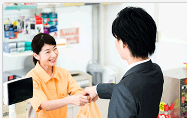
コンビニエンスストア