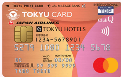
+即時発行カードほか