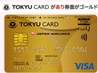
TOKYU CARD があり券面がゴールド